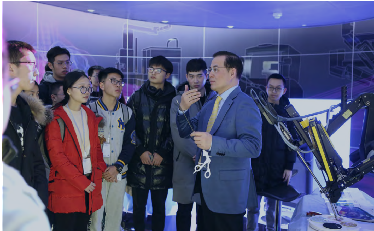
往期学员在哈姆林中心